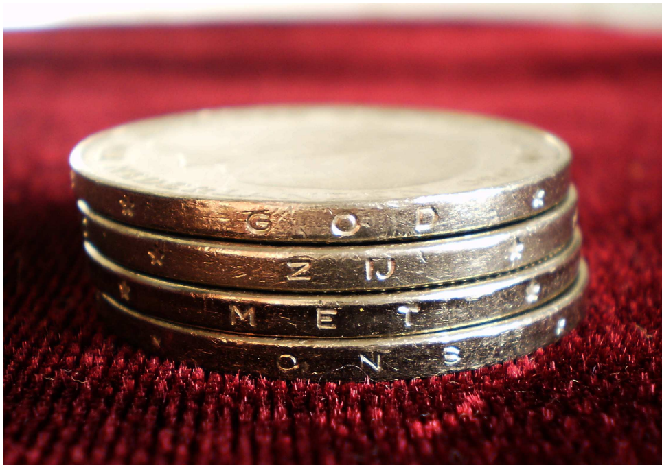
Figuur 3: Nederlandse rijksdaalders met randschrift