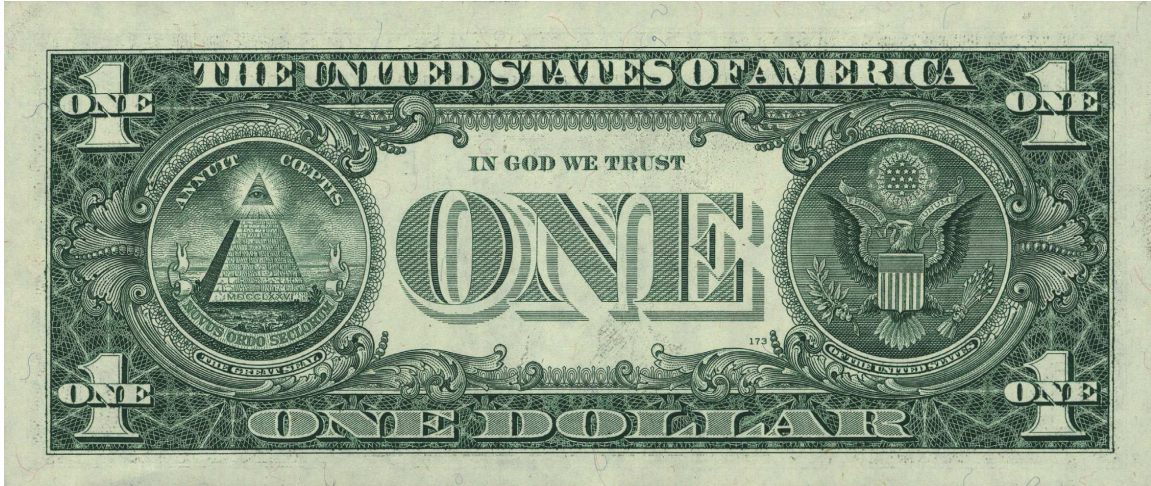
Figuur 2: Amerikaans "one dollar" biljet