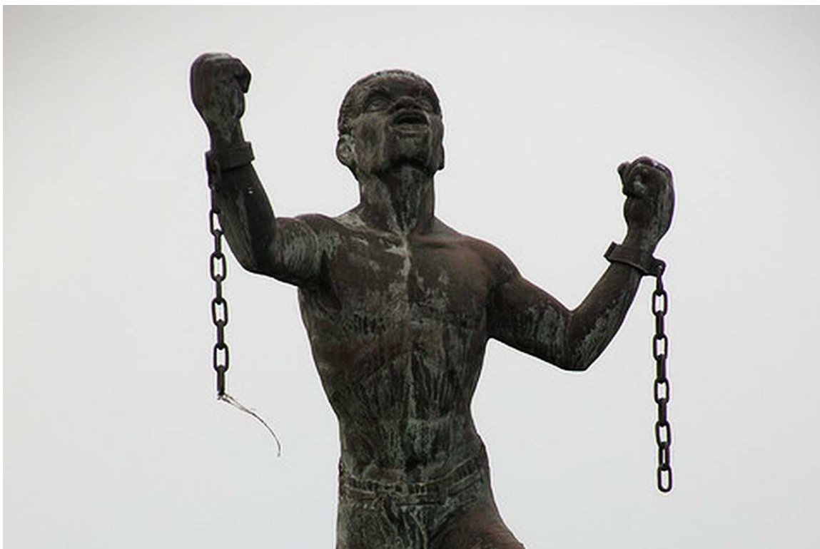
Figuur 1: Emancipation Statue Bussa Rising Barbados, Karl Broodhagen 1985