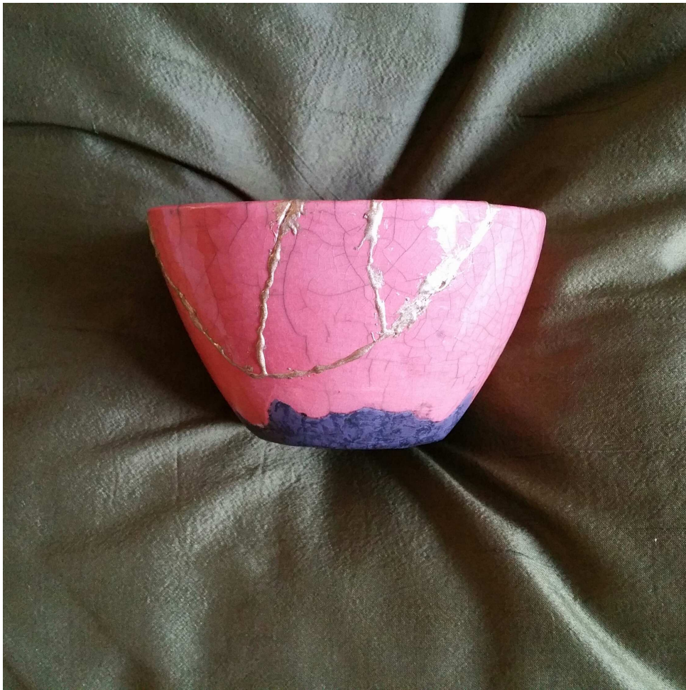
Figuur 2: Kintsugi aardewerk