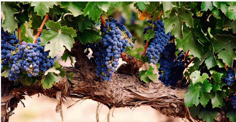
Figuur 2: Wijnstok