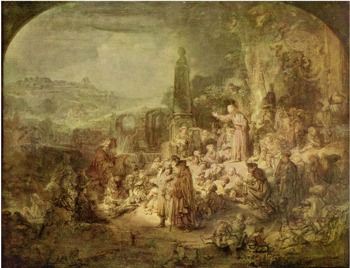
Figuur 2: Prediking van Johannes de Doper, Rembrandt 1634