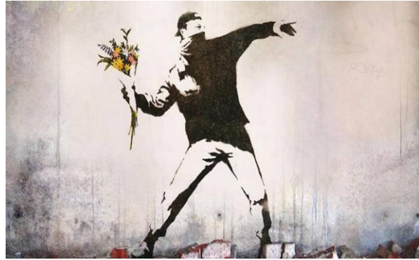
The Flower Thrower, Banksy (Streetart Bethlehem)

Schriftlezing Evangelie: Matteüs 5, 33-48